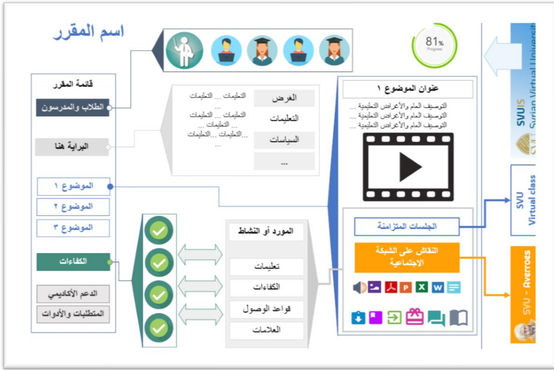
٢ - المكونات الأساسية للمقرر النموذجي